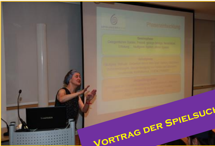
VORTRAG DER SPIELSUCHTHILFE WIEN