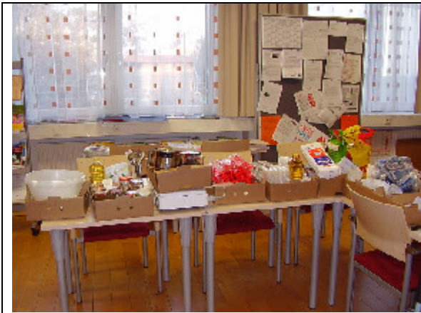
Vorbereitungen für die Versuche mit den SchülerInnen des BG im Lehrerzimmer der VS