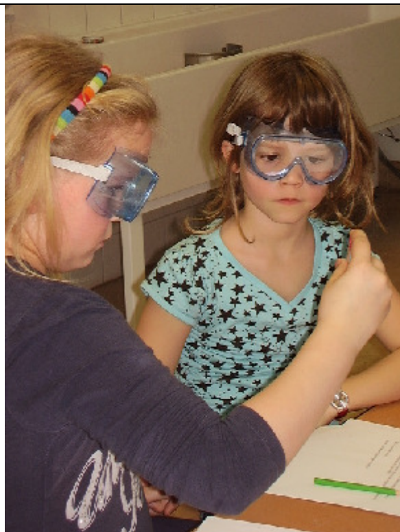
Die Kinder schauen ganz genau.