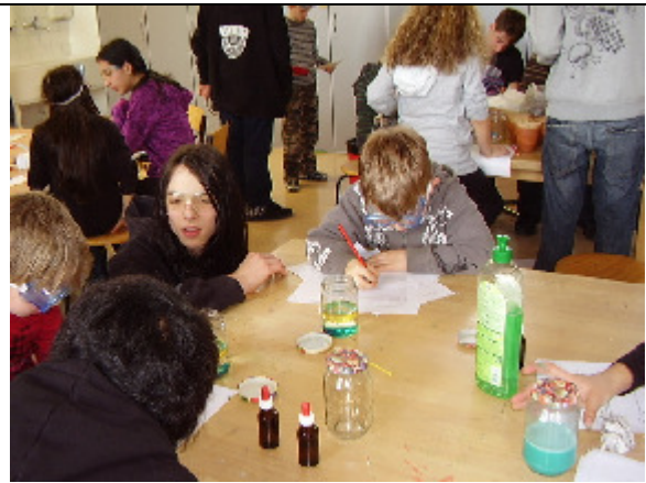
Versuch zu Wasser und Öl „Wie wird die Pfanne sauber?“