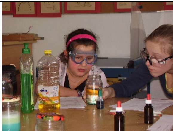
Versuch „Der schwebende Tintentropfen“ (unterschiedliche Dichte von Wasser und Öl)