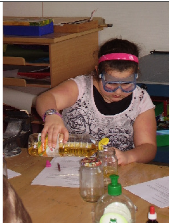
„Der schwebende Tintentropfen“