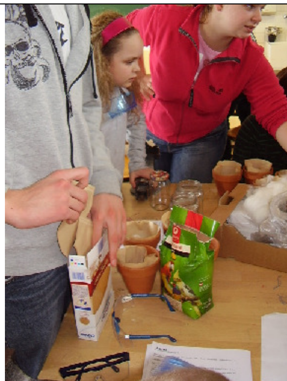
Das Modell einer Kläranlage wird ge- baut.