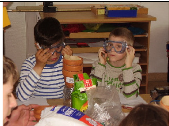
Schutzbrillen sind wichtig!