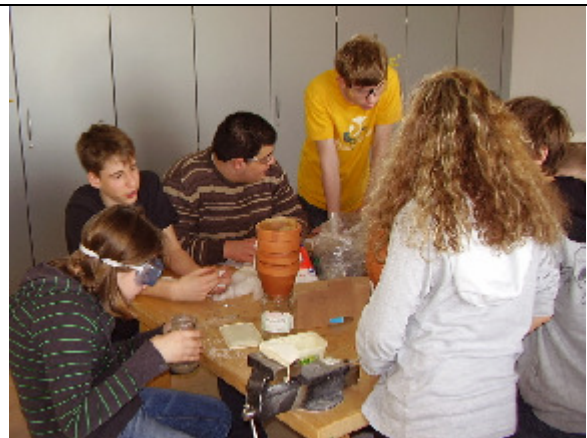
Das Modell einer Kläranlage wird gebaut.