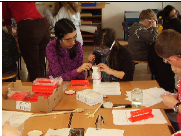
Versuch „Löslichkeit von Stoffen“