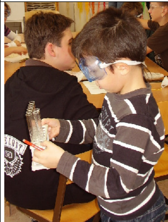
Dazwischen müssen Eprouvetten gereinigt werden.