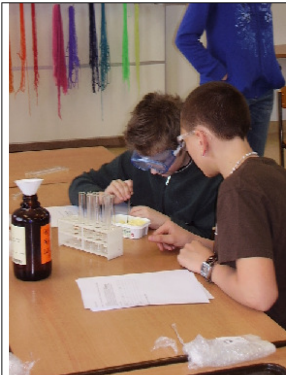
Es wird mit dem Spatel gearbeitet.