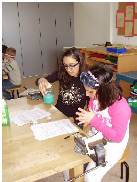
„Wie kann ich erklären was beim Ver- such passiert ist?“