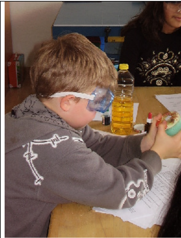
... und jetzt kräftig schütteln!