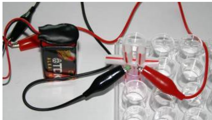
Chlor Alkali Elektrolyse