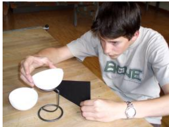
Abb. 12, 13: Ausrichtung des Gnomons (links) und der Skaphe im gewünschten Winkel (rechts)