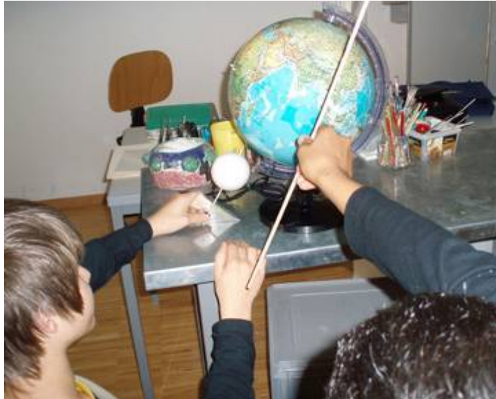
Abb. 1: Überprüfen des Neigungswinkels der Erdachse