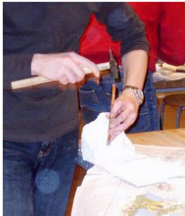
Abb. 2 – 10: Steinbearbeitung spricht taktile Lerntypen besonders an ...