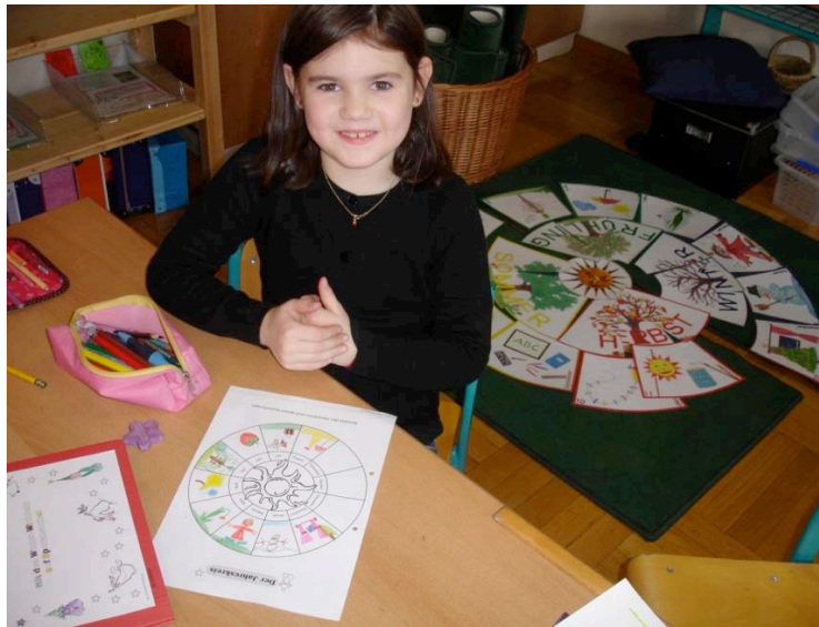
Eine „Chefin“ beim Erledigen ihrer Chefaufgabe

Wir arbeiteten an der Wichtel-Werkstatt bis Februar, da die Thematik sehr weitgreifend ist (Weihnachten, Weihnachtsbräuche und –gedichte, Tiere im Winter, Fasching, die Jahreszeiten, Rechenaufgaben, Bäume im Winter, .....).