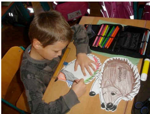
Fotos zu Igelprojekt