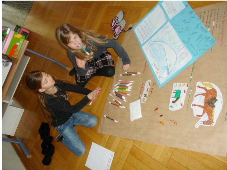
Das Pferdeplakat entwickelt sich in Gruppenarbeit