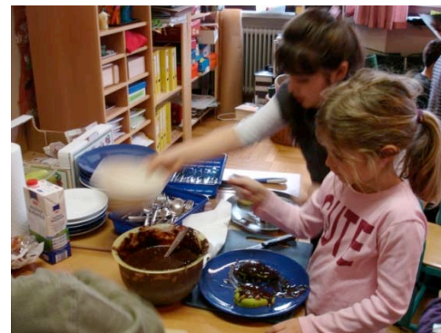
Ein süßer Birnenschokoladeigel wird zubereitet

Die tollen Ergebnisse bestärkten mich in meiner weiteren Überlegung der Förderung der Differenzierung und des Angebotes von Kernaufgaben. Im Internet fand ich unter www.zaubereinmaleins.de das tolle Projekt der „ Winter-Wichtel-Werkstatt “. Die Grundidee beeindruckte mich sofort, und ich begann mit der Umsetzung.