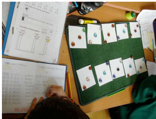
Das 1x3 – zuerst legen und verstehen, dann lernen

Ich kann jede Lehrperson zur Durchführung der Planarbeit ermutigen. Natürlich ist es anfangs noch sehr mühsam die Kinder in den Ordnungsrahmen einzuführen. Aber es lohnt sich ungemein! Ich kann und möchte darauf nicht mehr verzichten.