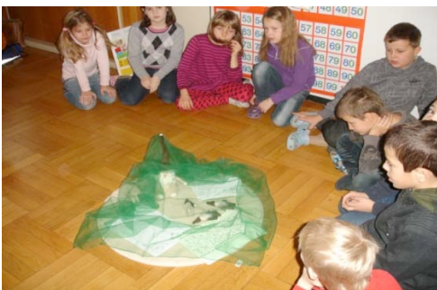
Die Winterwichtel waren in der Nacht hier

„Ich kann es dir erklären, aber nachdenken musst du schon selber!“