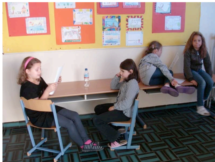
Blitzrechnen mit einem Partner am Gang