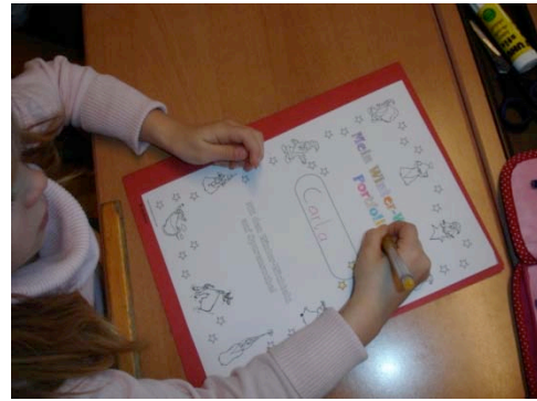
Das Deckblatt des Portfolios