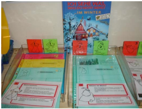
Der Aufbau der Wichtelstationen