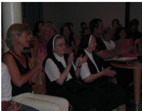
Begeisterung und Anerkennung