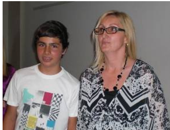
Freude und Stolz