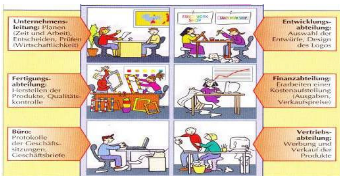
Bildquelle: Klappacher 2008, S.77

Die SchülerInnen waren von den erworbenen Unternehmerführerschein-Zertifikaten bestärkt und wollten beweisen, dass sie selbstständig arbeiten konnten. Mir war wichtig, die jungen Menschen in unternehmerischem Denken und Handeln zu fördern. Mit dem folgenden Schaubild erhielten die Jugendlichen einen Überblick zur Aufbau- bzw. Ablauforganisation eines Unternehmens.