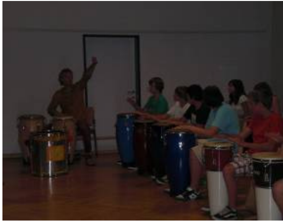
Trommeln im Gleichklang