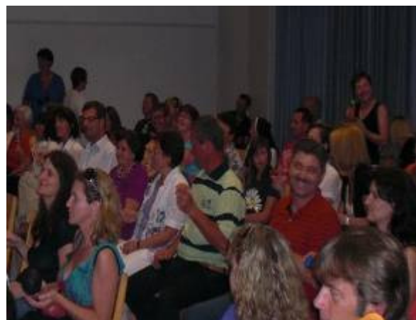
„Chill out“ im Publikum