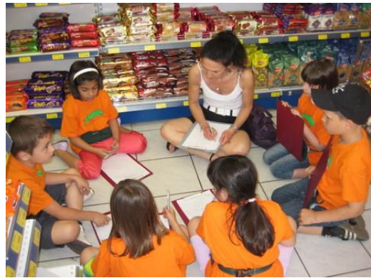
Besprechen, was gekauft wird.