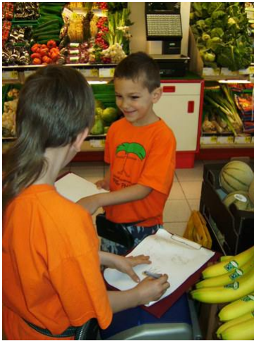
Preise und Waren notieren.