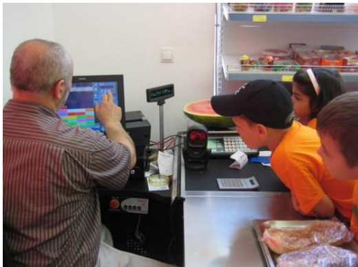
Wie funktioniert die Kassa?