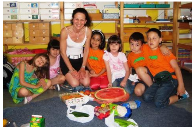
So viel kann man um dasselbe Geld kaufen