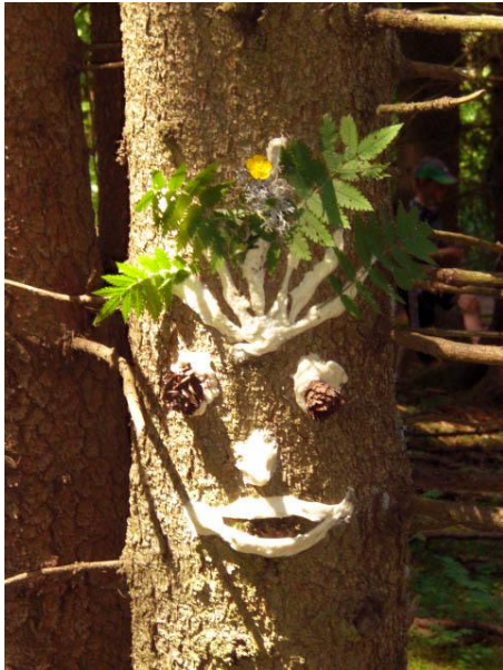
Waldgespenst aus Salzteig