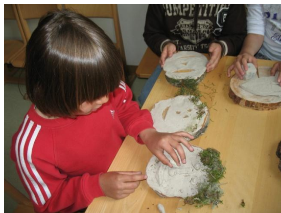
Waldgesichter in der Klasse auf Baumscheiben gestalten