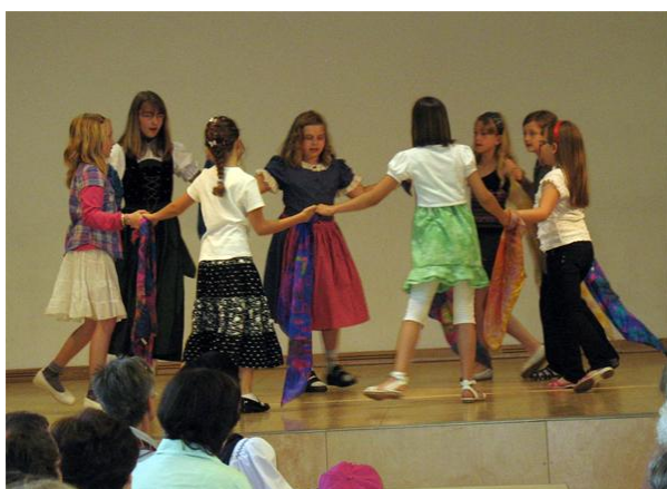
Tanz der Bionikerinnen

Mit Tanz und Theater wird Bionik näher erklärt