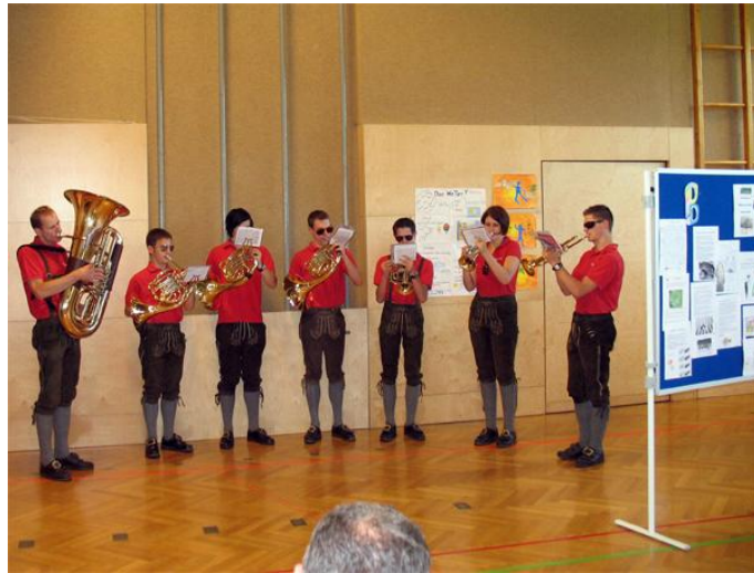
Die Mareiner- Brass spielt auf