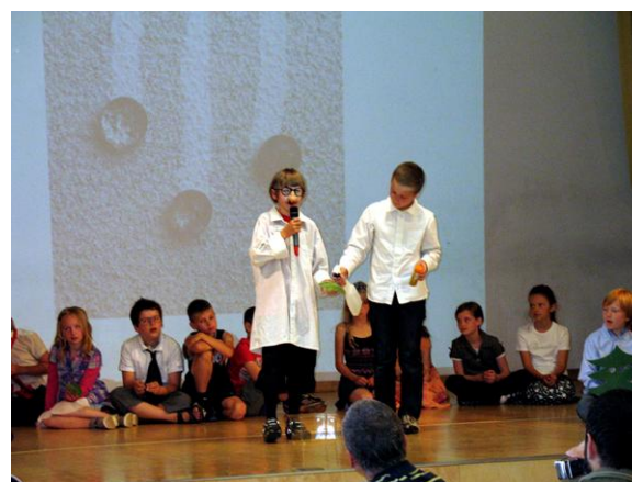
Professor Vifzack und Assistent