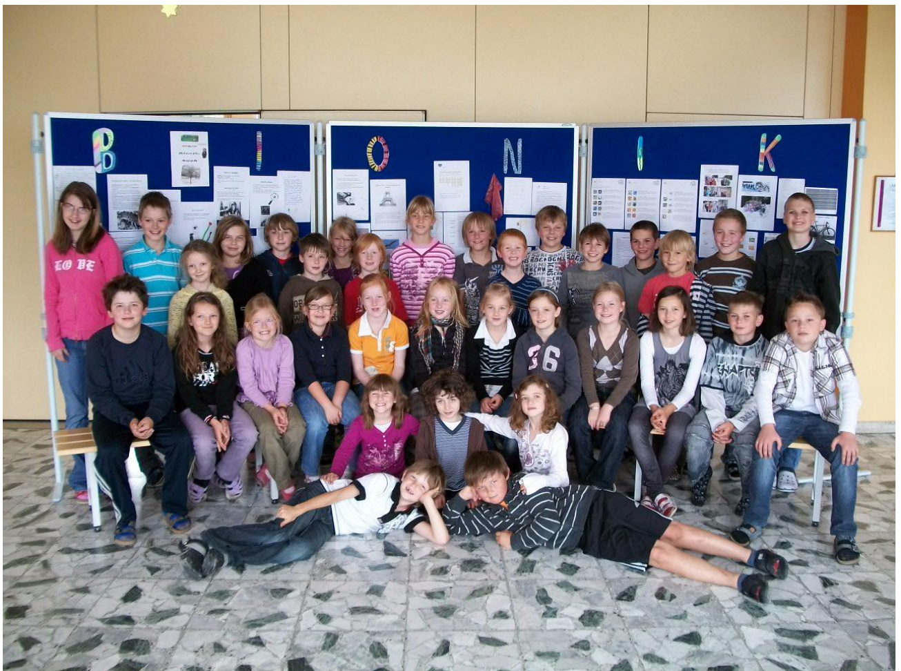
Unsere Jung-Bioniker vor der Schautafel