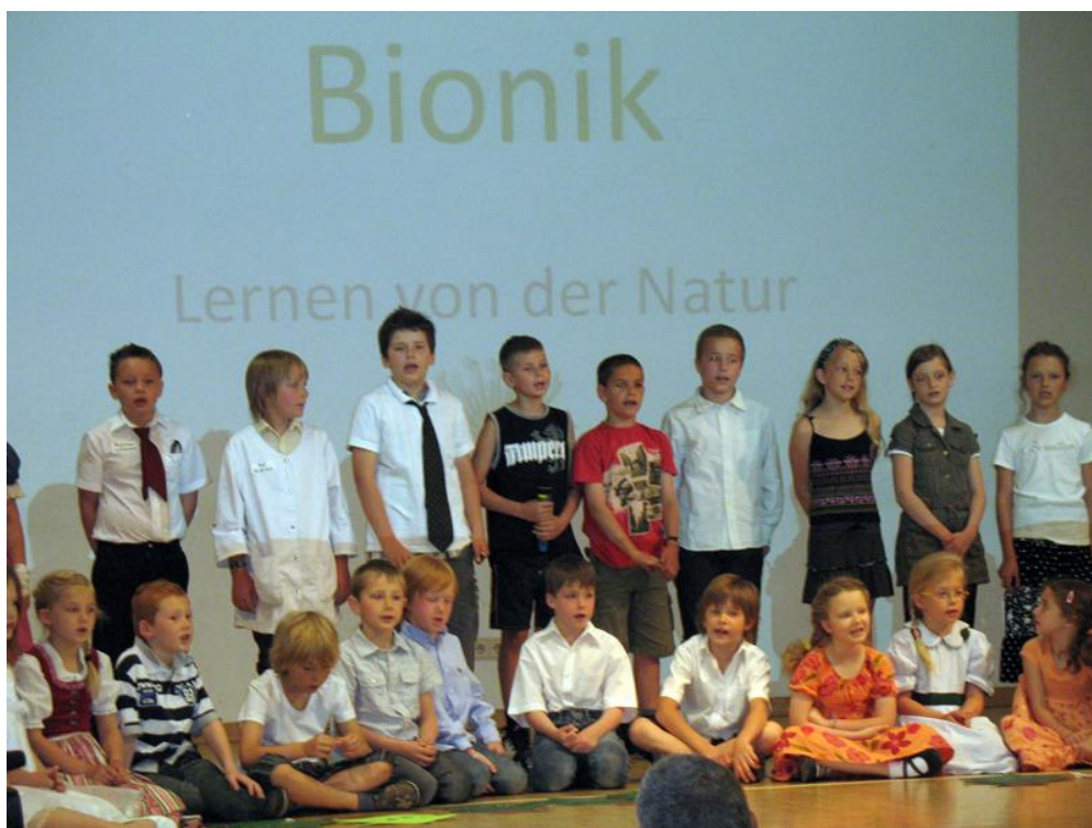
Bionik-Song Solosänger (stehend)

Mit Tanz und Theater wird Bionik näher erklärt