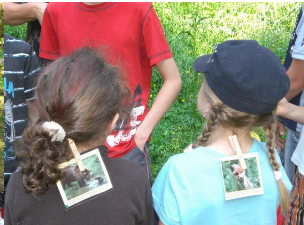
Wer bin ich?