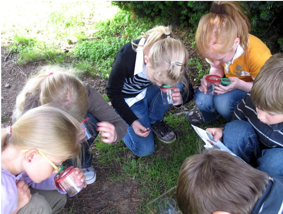
Mit Becherlupe unterwegs