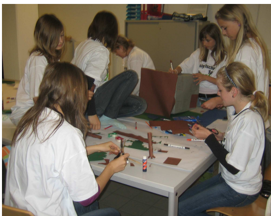
Mädchengruppe bei ASFINAG

Bei der Firma Deakon Degen durften sie Kabeln verbinden. Die Mädchen, die diese Firma besuchten, waren begeistert von der Arbeit, die sie machen durften.