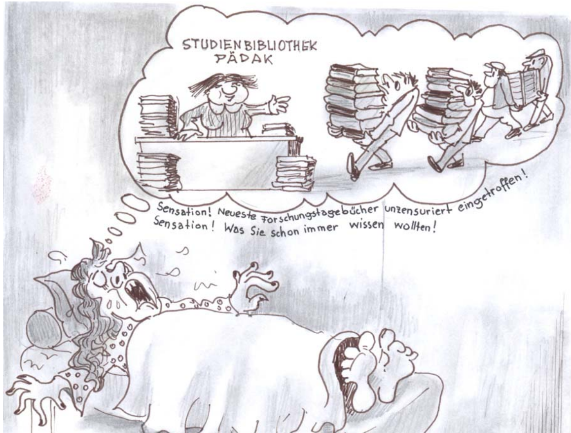
Albtraum eines Studenten/einer Studentin bezüglich der Schulpraktischen Studien!