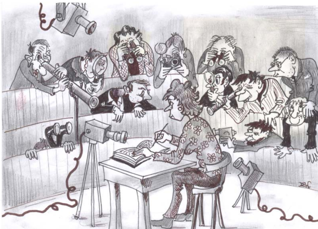
„Big Brother is watching you“

Für unsere Studierenden bedeutet dies eine schreibakrobatische Leistung, einen pädagogischen Spagat zu vollbringen: Einerseits schreiben sie für sich, sollen durch das Schreiben die eigene Reflexionskompetenz erhöhen, sollen das private Schreiben nutzen, um das öffentliche Gespräch mit Impulsen und Fragestellungen zu bereichern, und sie haben zugleich das Recht, nicht sagen zu müssen, wie sie bestimmte Dinge im Unterricht oder während einer Hospitation erlebt, gefühlt, bedacht und „wahr-genommen“ haben, weil es sich um privates Schreiben handelt. Eine mögliche Kontrolle bzw. Überprüfung durch PraxislehrerInnen oder PraxisbetreuerInnen dient nicht der Sache.