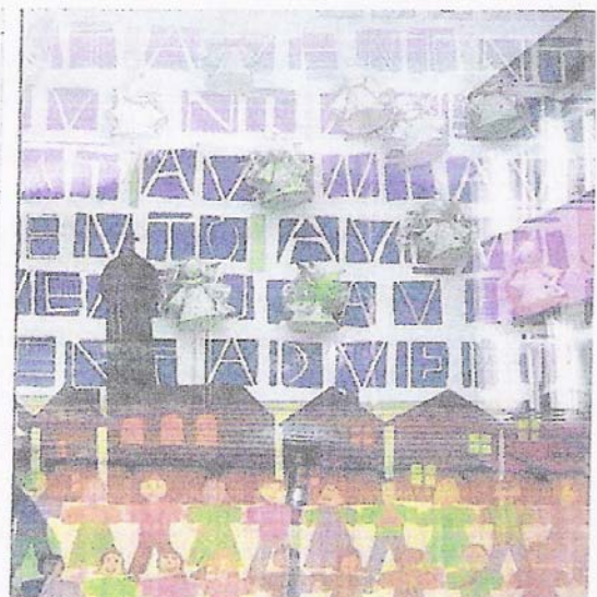
So schön war das Adventfenster an der Hauptschule in Friedburg.