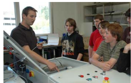
Kontrolle unseres Kastens