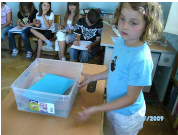
Abbildung 3: Das Pappeboot