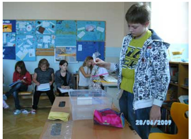
Abbildung 4: Das Löchersackerl