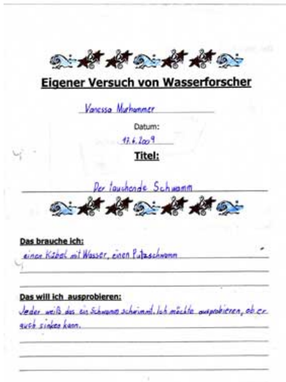
Abbildung 1: Planung