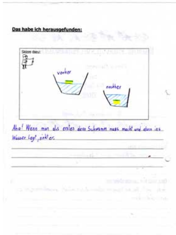
Abbildung 2: Planung