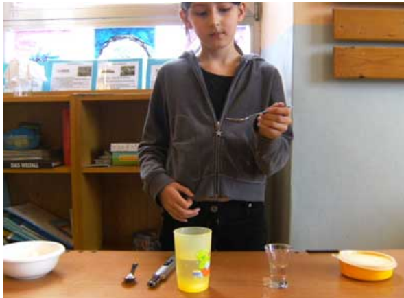
Abbildung 1: Vorführung von „Lust auf Süßes“