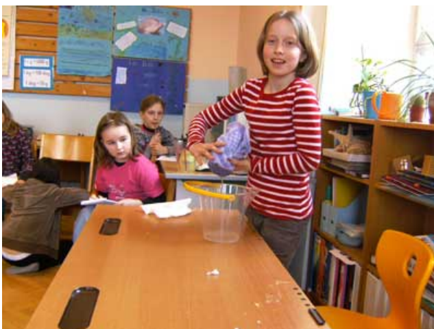
Abbildung 5: Das tauchende Handtuch