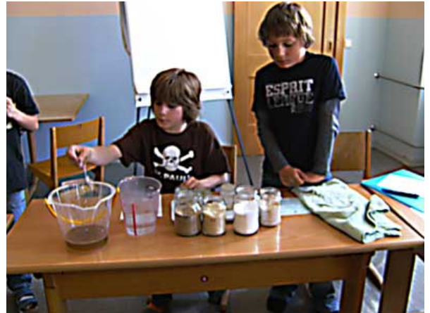
Abbildung 2: Welche Stoffe lösen sich in Wasser auf?