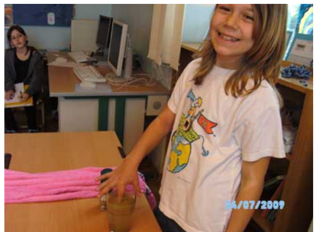
Abbildung 6: Der trockene Finger