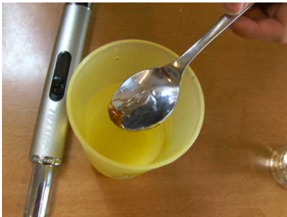
Abbildung 3: Sie erhält Karamell