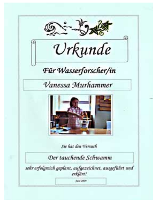
Abbildung 4: Urkunde