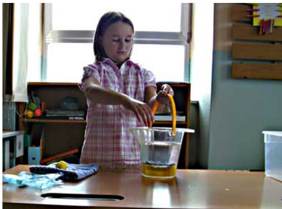
Abbildung 3: Vorführung