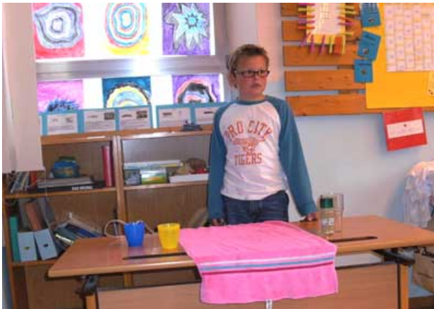
Abbildung 9: Saug- oder Schwerkraft?