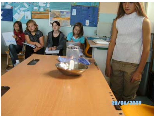
Abbildung 11: Der Wasserstaubsauger