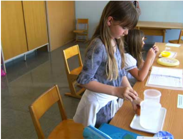
Abbildung 1: Löst sich Salz ohne Rühren auf?